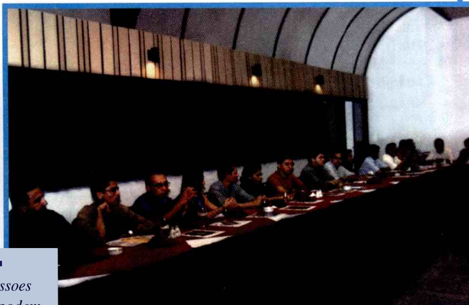
Assoc iaffiraffiff de Teresina discutem linhas de credito disponiveis aos lojistas

"As concessoes de credit° podem ser aplicadas na abertura de novos negocios ou na ampliaccio dos atuais"