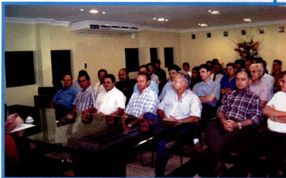
Informações: Lojistas recebem esclarecimentos técnicos em reunião na sede da CDL